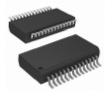
MCP23016T-I/SS Micrel / Microchip Technology IC I/O EXPANDER I2C 16B 28SSOP